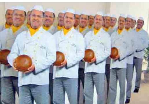
Rund 500 lebensgroße Werbeaufsteller verlassen jährlich das Unternehmen.